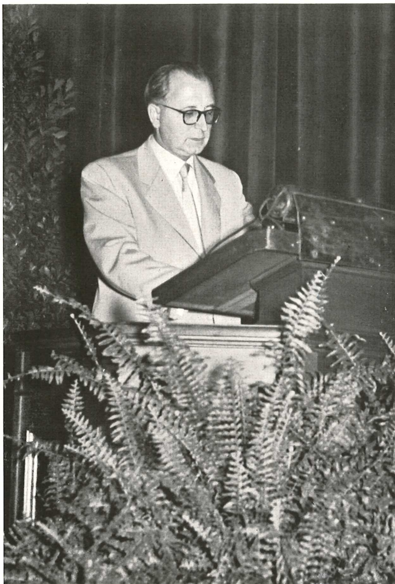
Ministerialrat Steuer Bundesministerium für Ernährung, Landwirtschaft und Forsten in Bonn