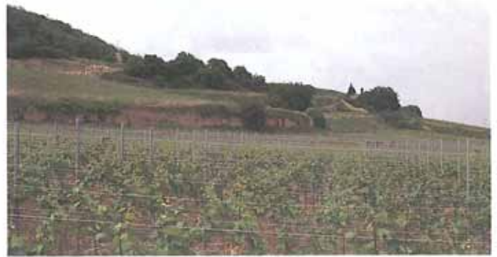
Hahnenböhler Kreuz – Landespflegerischer Kernbereich

Zusammenfassend ist festzustellen, daß in der Weinbergflurbereinigung Deidesheim-Forst die Forderungen des Weinbaues nach Beseitigung der agrarstrukturellen Mängel mit den Zielsetzungen der Wasserwirtschaft, der Landespflege und der Denkmalpflege in Einklang gebracht wurden. Durch weitgehende Beibehaltung der bedeutsamen Landschaftsstrukturen und umweltschonende Bauweisen (Gabionen, Pflasterweg) blieb der am Haardtrand typische Landschaftscharakter erhalten. Deshalb ist die Weinbergflurbereinigung Deidesheim-Forst als richtungsweisend anzusehen.