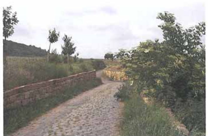
Pflasterweg mit Mauern