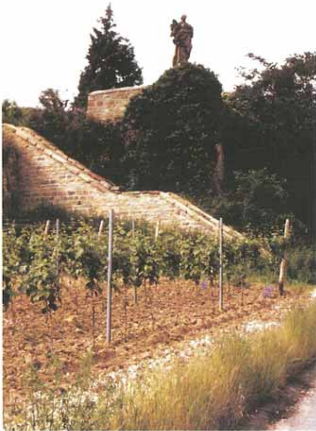
Madonna im Weinberg