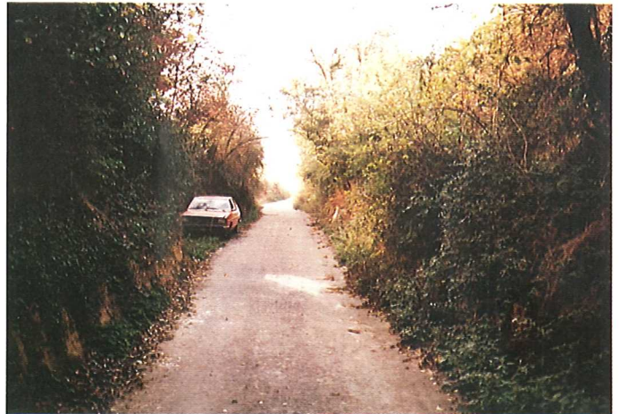
Hohlweg nach dem Ausbau (Begegnungsverkehr durch Ausweichstellen möglich)