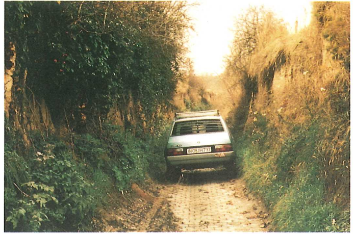
Hohlweg vor dem Ausbau (kein Begegnungsverkehr möglich)

In der Weinbergslurbereinigung Guntersblum ist der Versuch gelungen, ökologische Zielsetzungen mit den aus der Sicht der Winzer vordringlichen wirtschaftlichen Erfordernissen in Einklang zu bringen. Deshalb kann diese Flurbereinigung als Vorbild für künftige Verfahren dienen.