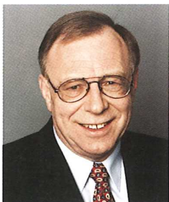
Hans Artur Bauckhage Minister für Wirtschaft, Verkehr, Landwirtschaft und Weinbau

► Als der Ministerrat im März 1995 die Leitlinien für das Programm „Ländliche Bodenordnung 1995 – 1999“ verabschiedete, erhielt die Landeskulturverwaltung den Auftrag, verstärkt an der Lösung der vielfältigen Ordnungs- und Entwicklungsaufgaben im ländlichen Raum mitzuwirken. Dieses Aufgabenspektrum umfasst auch die Dorfflurbereinigung, deren Ziel die Erhaltung bzw. Stärkung der vielfältigen Funktionen der Dörfer in ökonomischer, ökologischer, sozialer und kultureller Hinsicht darstellt.