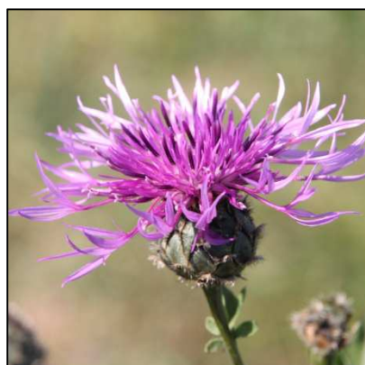
Skabiosen-Flockenblume ( Centaurea scabiosa )