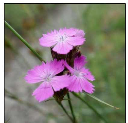
Karthäusernelke ( Dianthus carthusianorum )