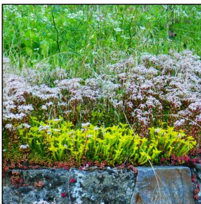
Weißer Mauerpfeffer und Scharfer Mauerpfeffer (gelb) ( Sedum album und Sedum acre )