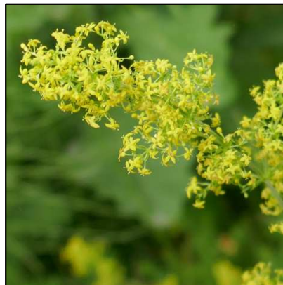
Echtes Labkraut ( Galium verum )