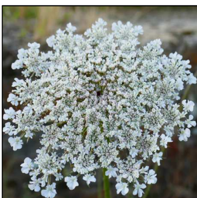
Wilde Möhre ( Daucus carota )