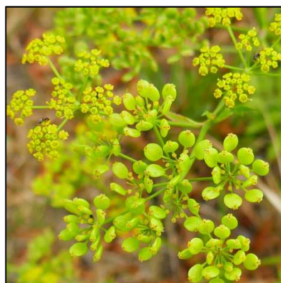
Gewöhnlicher Pastinak ( Pastinaca sativa )