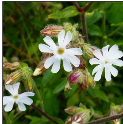
Weißer Lichtnelke ( Silene latifolia )