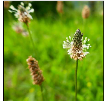
Spitzwegerich ( Plantago lanceolata )