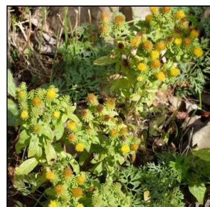
Dürrwurz ( Inula conyzae )