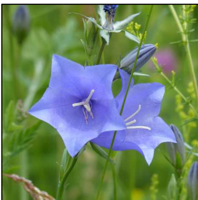
Rundblättrige Glockenblume ( Campanula rotundifolia )