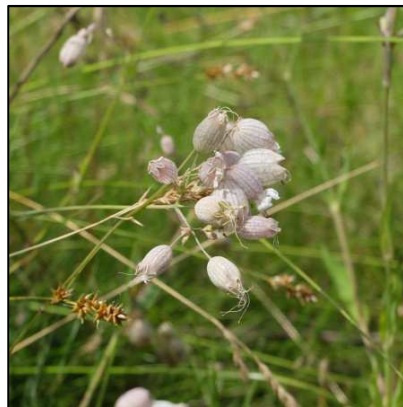
Taubenkropf-Leimkraut ( Silene vulgaris )