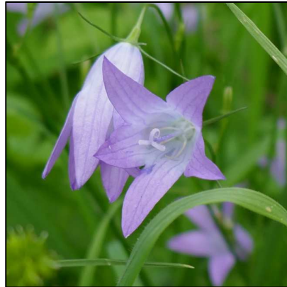
Rapunzel-Glockenblume ( Campanula rapunculus )