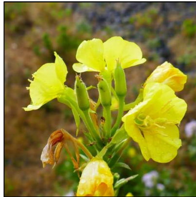
Gemeine Nachtkerze ( Oenothera biennis )