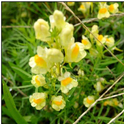
Echtes Leinkraut / Wildes Löwenmaul ( Linaria vulgaris )