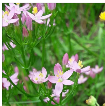
Echtes Tausendgüldenkraut ( Centaurium erythraea )