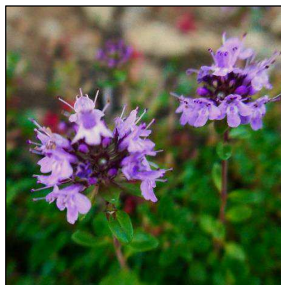
Arzneithymian ( Thymus pulegioides )