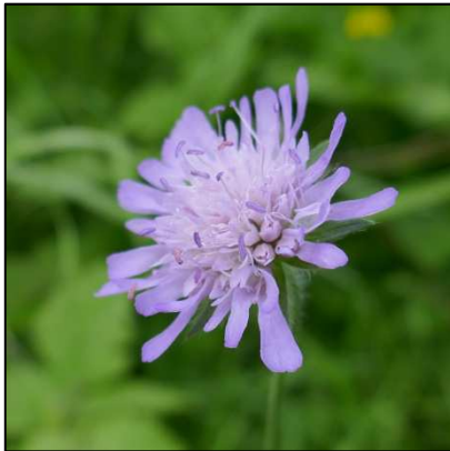
Acker-Witwenblume ( Knautia arvensis )