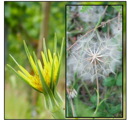
Wiesenbocksbart ( Tragopogon pratensis )