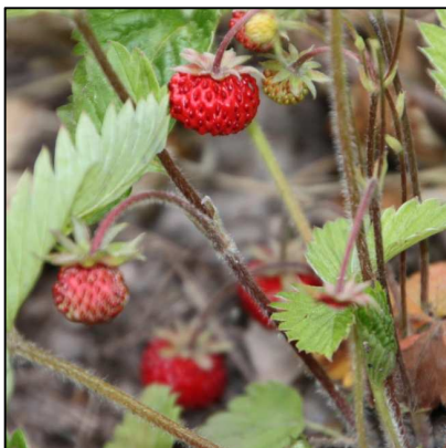
Wald-Erdbeere ( Fragaria vesca )