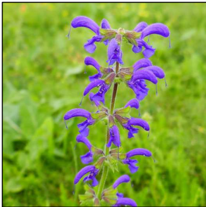
Wiesensalbei ( Salvia pratensis )