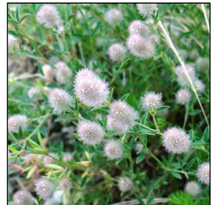
Hasenklie ( Trifolium arvense )