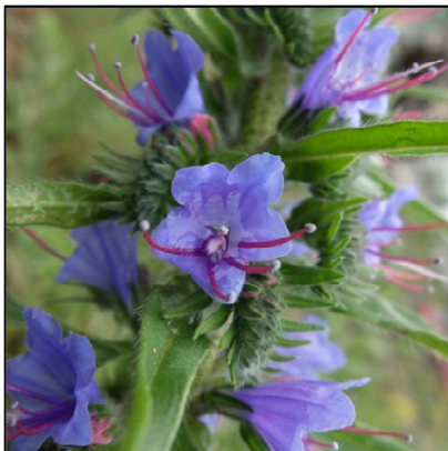
Gewöhnlicher Natternkopf ( Echium vulgare )