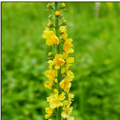
Gewöhnlicher Odermennig ( Agrimonia eupatoria )