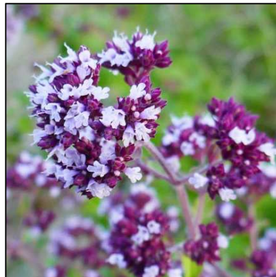
Dost / Wilder Majoran ( Origanum vulgare )