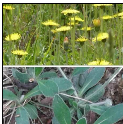
Kleines Habichtskraut ( Hieracium pilosella )