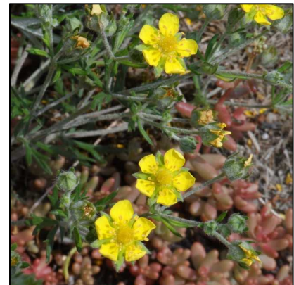
Silberfingerkraut ( Potentilla argentea )