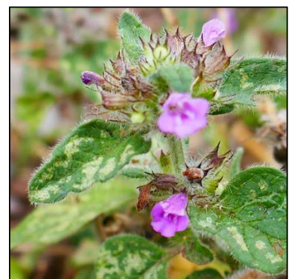
Gewöhnlicher Wirbeldost ( Clinopodium vulgare )