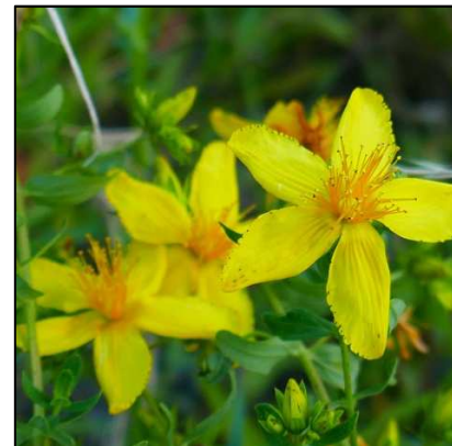
Tüpfel-Johanniskraut ( Hypericum perforatum )