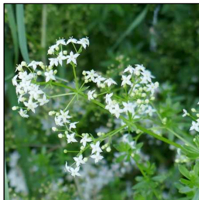
Weißes Labkraut ( Galium album )