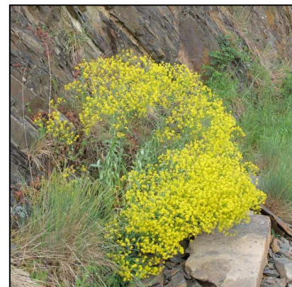
Färberwaid ( Isatis tinctoria )