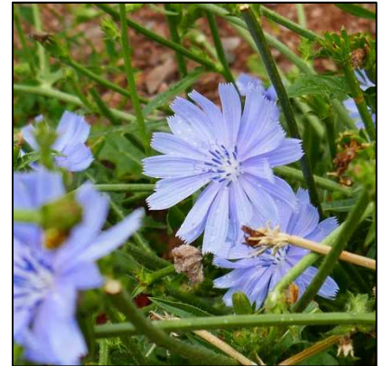
Gewöhnliche Wegwarte ( Cichorium intybus )