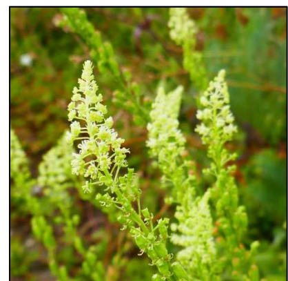
Gelber Wau / Gelbe Resede ( Reseda lutea )