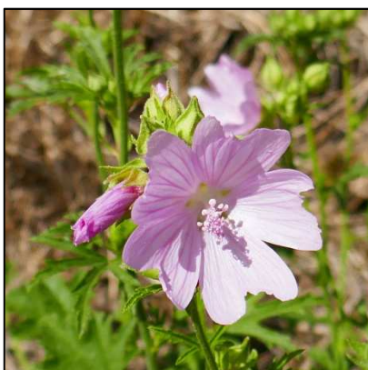
Moschus-Malve ( Malva moschata )