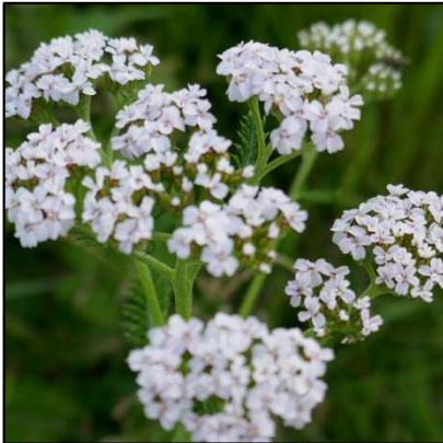
Gewöhnliche Schafgarbe ( Achillea millefolium )

Im Rahmen des „Moselprojekts“ unterstützen Winzerinnen und Winzer deren Ansiedlung mittels Ansaaten in den Steillagen-Rebflächen. So fördern sie die Artenvielfalt in der Flora und der assoziierten Fauna.