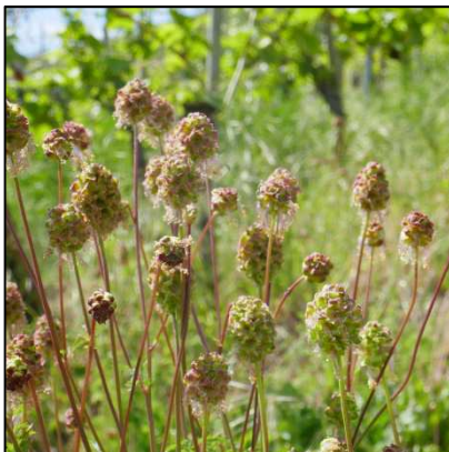
Kleiner Wiesenknopf ( Sanguisorba minor )